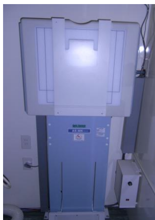
デジタル胸部X線装置