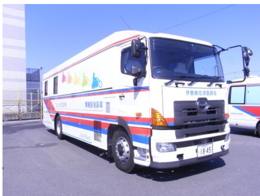
胃胸部併用X線デジタル検診車